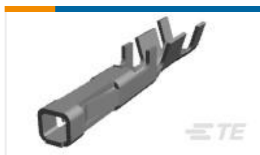
TE 产品编号1-794610-2 MICRO MNL RPT CNT,LS PC 30AU L