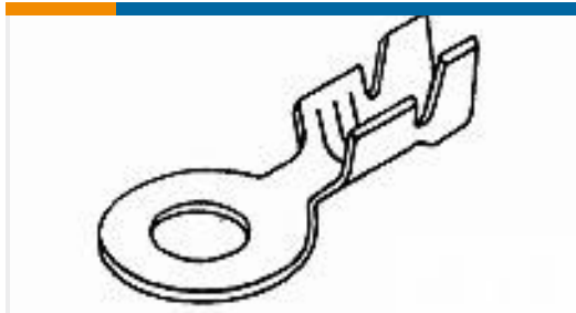
TE 产品编号42864-2 RING CRIMP 12-10 AWG TPBR