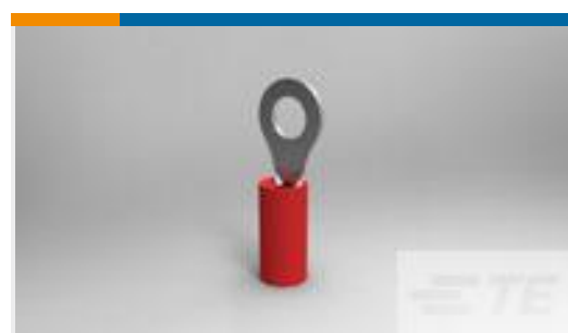
TE 产品编号1-320551-1 PIDG R 22-16 COMM 22-18 MIL 8