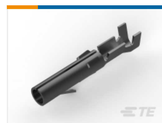
TE 产品编号 61314-1 CMNL SOK 24-18 TPBR