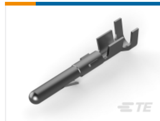
TE 产品编号 60618-4 CMNL PIN PTPPHBZL/P