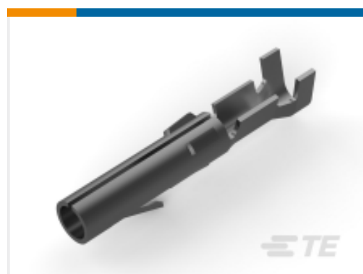
TE 产品编号 60617-1 CMNL SOK SNBR L/P