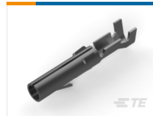
TE 产品编号 60617-4 CMNL SOK PTPPHBZ L/P