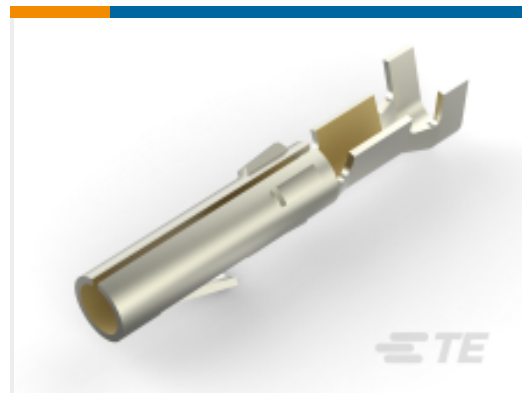
TE 产品编号 60617-5 CMNL SOK AUBR L/P