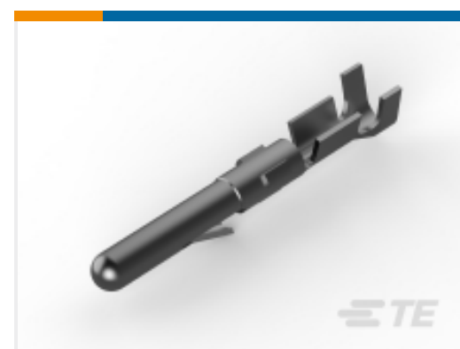
TE 产品编号 61116-4 CMNL PIN 24-18 PTPHBZ