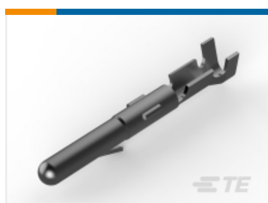
TE 产品编号 163555-6 MATENLOK PIN