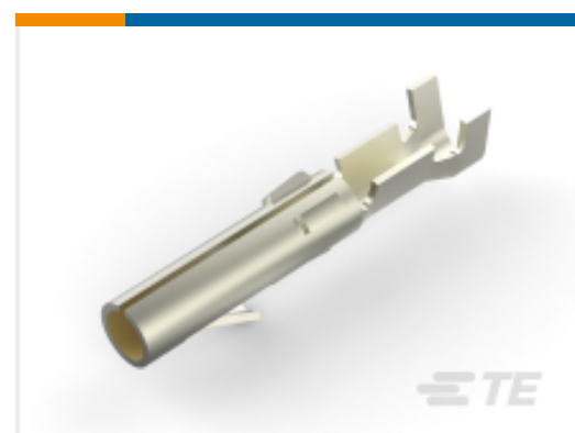
TE 产品编号 61314-6 CMNL SOK S/F 24-18 .0125AUPHBZ