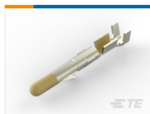
TE 产品编号 61116-5 CMNL PIN 24-18 AUNIBR