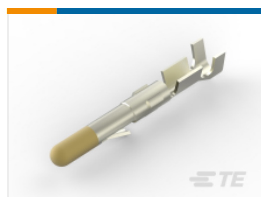
TE 产品编号 61116-6 CMNL PIN 24-18 AUNIPHBZ