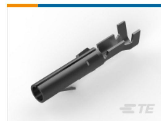
TE 产品编号 61314-4 CMNL SOK 24-18 TTPHBZ