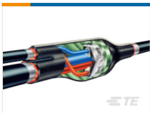
TE 产品编号 A04332-000 BMHM-1001-4B1-4874(S4)