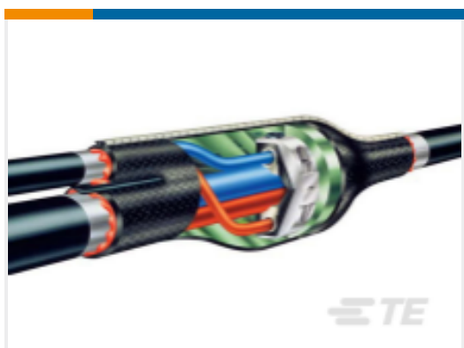
TE 产品编号 D73536-000 BMHM-1001-4B1-6875(S4)