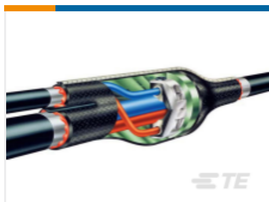
TE 产品编号 371941-000 BMHM-1001-4B1-(S4)