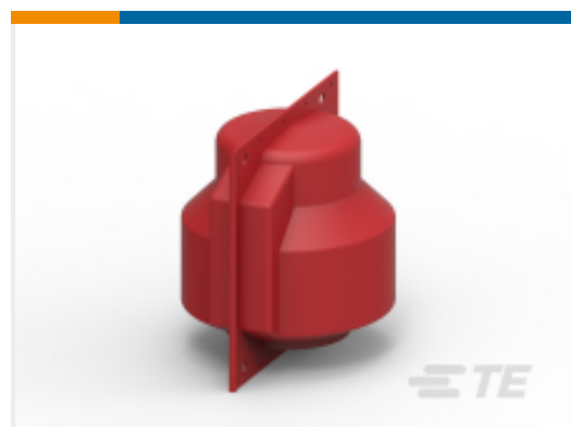
TE 产品编号 BM9876-000 BCIC-3111-AL(B10)