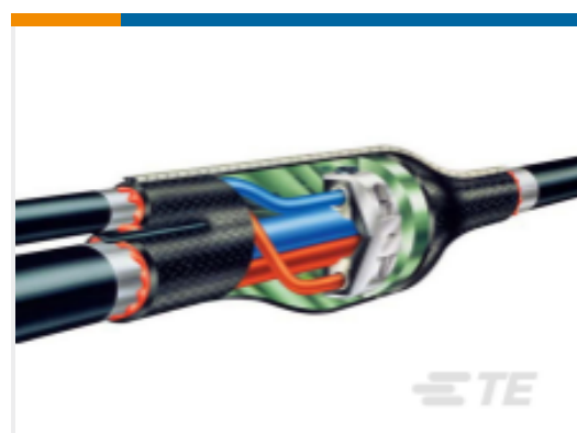
TE 产品编号 543790-000 BMHM-1001-4C1-6878(S4)