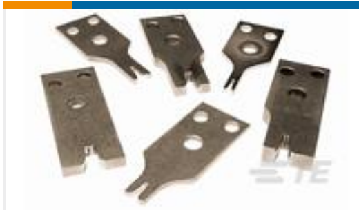
TE 产品编号2-655830-3 ISOLATIONSCRIMPER