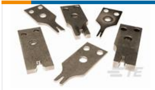
TE 产品编号1-453818-9 CRIMPER WIRE .055 WIDE F