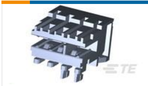
TE 产品编号2-1534796-3 AMP DUOPLUG MK2 CONNECTOR 3P