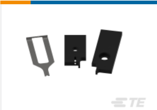
TE 产品编号2119781-1 DEPRESSOR, SHEAR