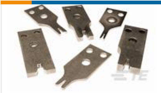
TE 产品编号5-456134-2 CRIMPER, INSULATION "F"(.070")