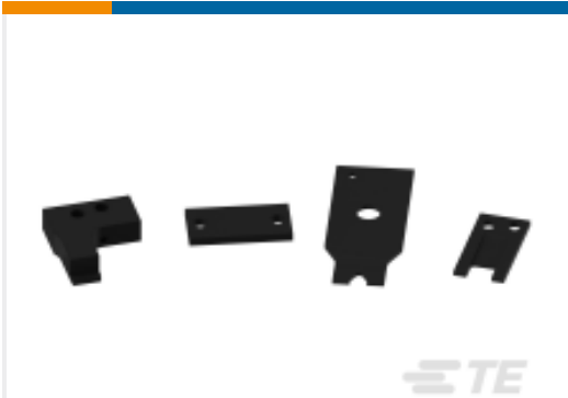
TE 产品编号659547-1 MESSER KP