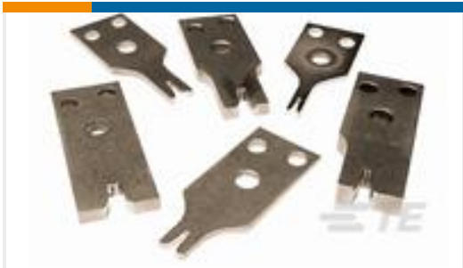
TE 产品编号5-458141-2 CRIMPER, WIRE SP. (.110" 'F')