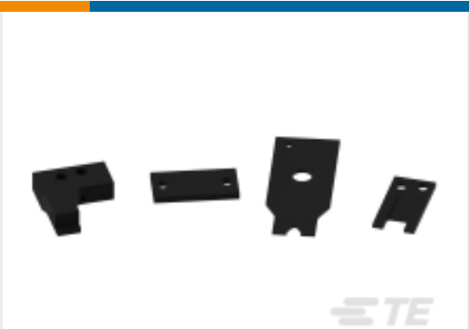
TE 产品编号654353-3 MESSERHALTER KL