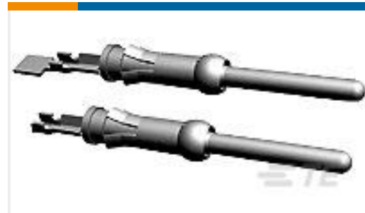
TE 产品编号1-66359-6 III+ PIN,18-14,30AU/FL,STRIP