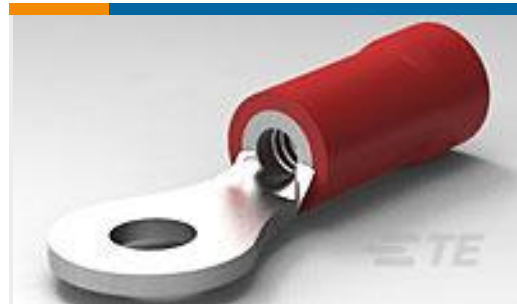
TE 产品编号34143 PG R 22-16 COMM 22-18 MIL 4