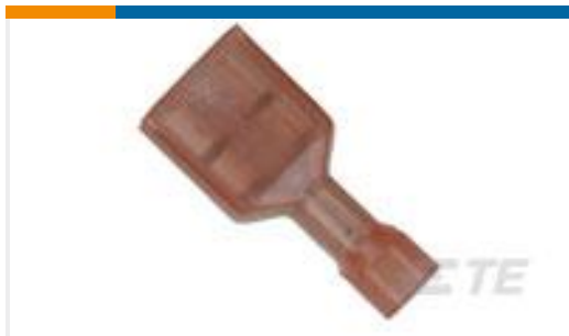
TE 产品编号2-520183-2 ULTRA-FAST 250 ASY REC 22-18 TPBR