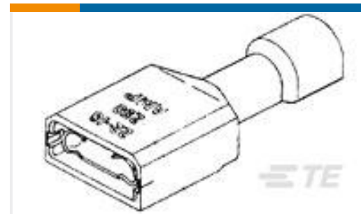
TE 产品编号5-520183-2 ULTRA-FAST 250 ASY REC 22-18 AWG TPBR