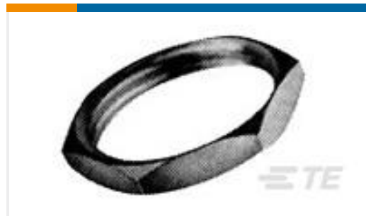
TE 产品编号1-330249-1 JAM NUT