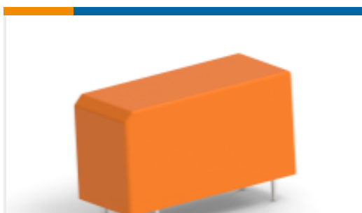
TE 产品编号9-2158000-5 RZ03-1AL-D024-R