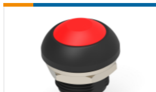
TE 产品编号1-2329383-7 PB OFF/ON FC RED M4 TERM. IP68