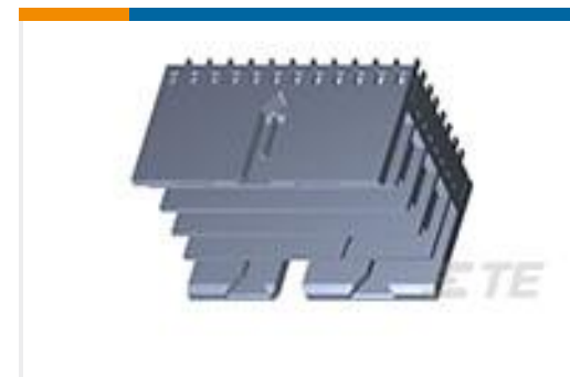
TE 产品编号 2042088-2 Vert. Male, IEC L2