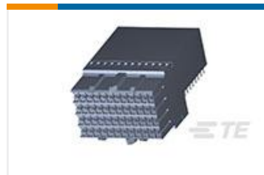
TE 产品编号 1982738-2 Female Connector IEC