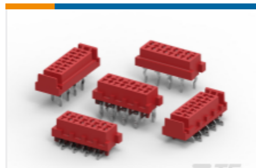
TE 产品编号 9-338069-4 Female-on-Board Connector, Top Entry