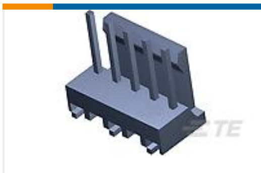
TE 产品编号 3-647502-5 05P MTA100 HDR ASSY, SM, SN, LF