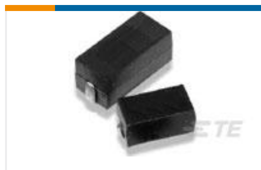
TE 产品编号8-1879233-5 SMW5 330R 5%