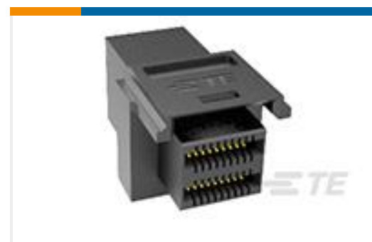
TE 产品编号2227580-1 1X1 R/A ASSY, MINI SAS HD INTERNAL