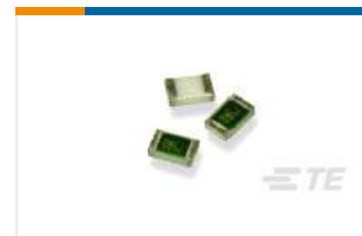
TE 产品编号1-1879214-9 CPF 0402 499R 0.1% 25PPM 1K RL