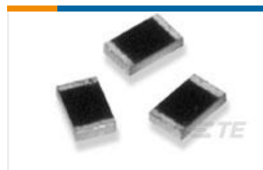
TE 产品编号1-1625867-3 RP 1J 0.166W 9K09 0.1% 25PPM 1K RL