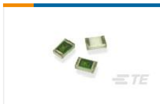
TE 产品编号1-2176090-7 RP 1J 0.166W 191K 0.1% 25PPM 1K RL