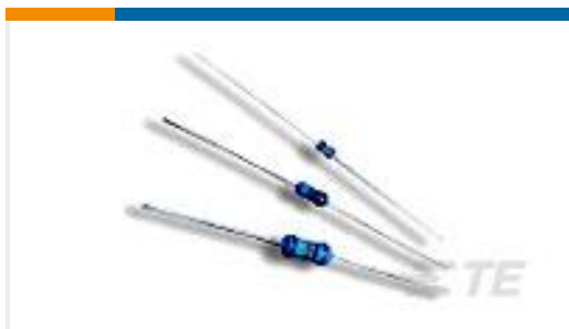
TE 产品编号1622414-1 LR1 1% 2K2