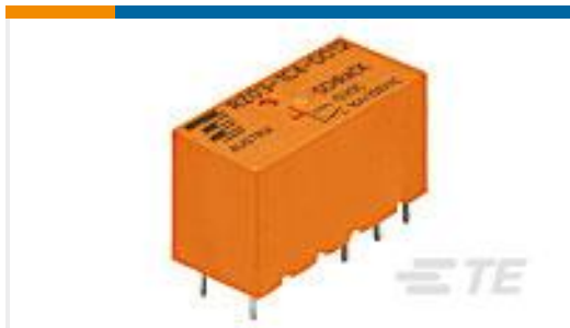
TE 产品编号1-1415899-1 RZ01-1C4-D024