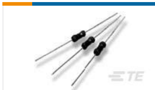
TE 产品编号1625890-4 2W SM M/OX 5% 100R