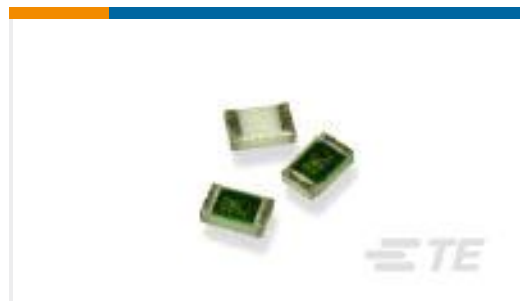
TE 产品编号1879337-1 CPF 0603 2K49 1% 50PPM 1K RL