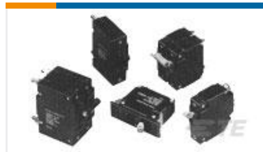
TE 产品编号5-1393252-6 W67-X2Q12-15=M6/M7/M9/W6/W7