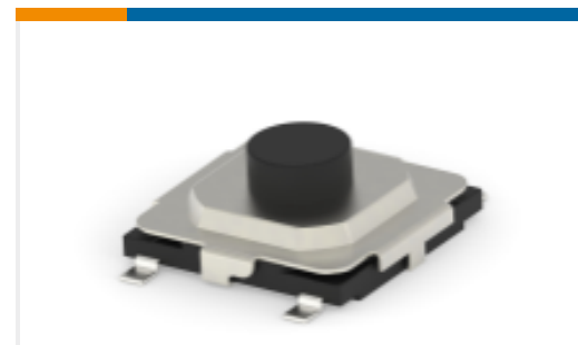
TE 产品编号2337238-3 TACT MINI GW 5.2X5.2X2 160GF