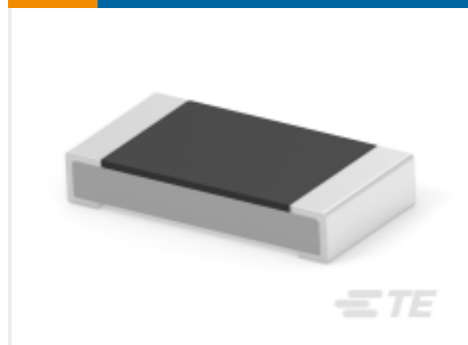
TE 产品编号2-2176392-9 RQ 1206 261K 0.1% 10PPM 5K RL