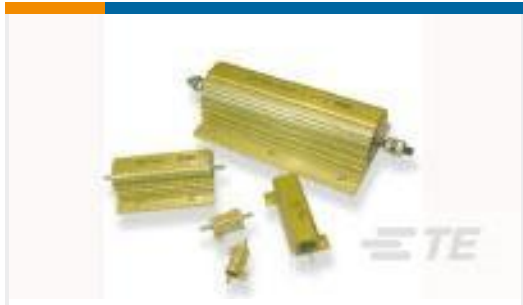
TE 产品编号9-1625971-5 HSA25 R01 10%