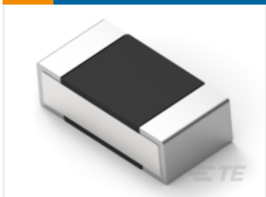
TE 产品编号3-2176307-2 RP 1E 0.1W 26K1 0.1% 25PPM 5K RL