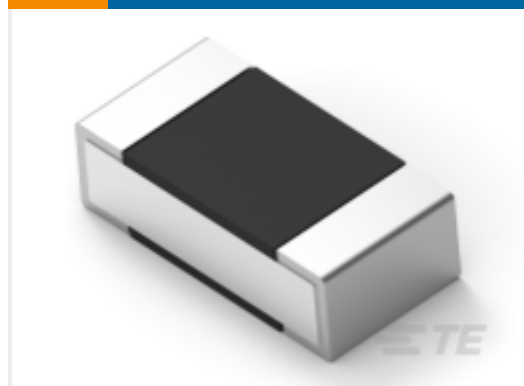
TE 产品编号7-2176305-3 RP 1E 0.1W 604R 0.1% 25PPM 5K RL