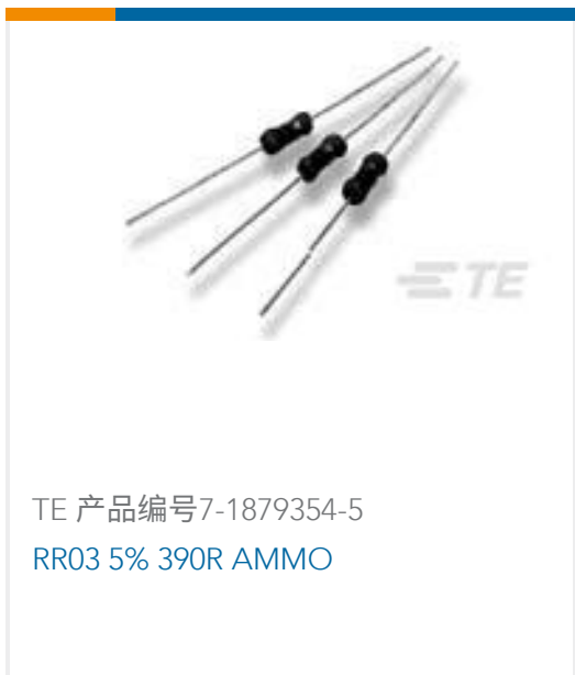
TE 产品编号7-1879354-5 RR03 5% 390R AMMO