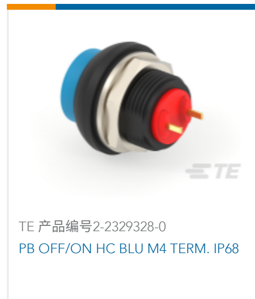
TE 产品编号 2-2329328-0 PB OFF/ON HC BLU M4 TERM. IP68