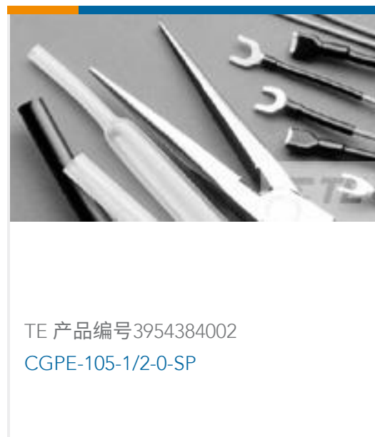
TE 产品编号 3954384002 CGPE-105-1/2-0-SP