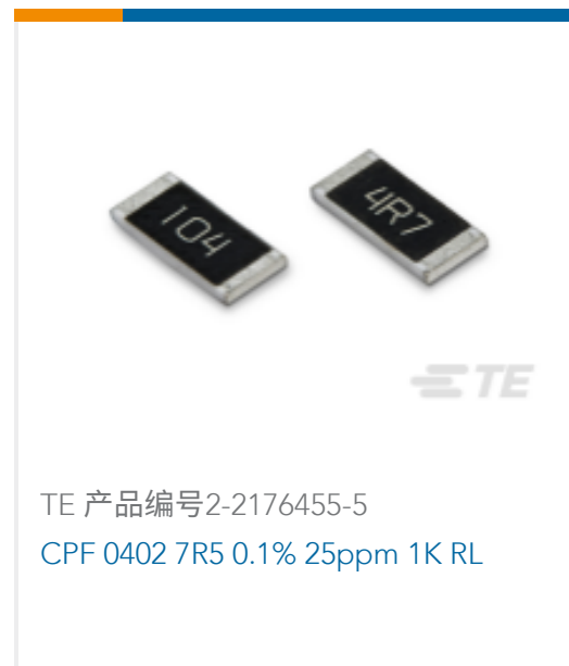
TE 产品编号 2-2176455-5 CPF 0402 7R5 0.1% 25ppm 1K RL