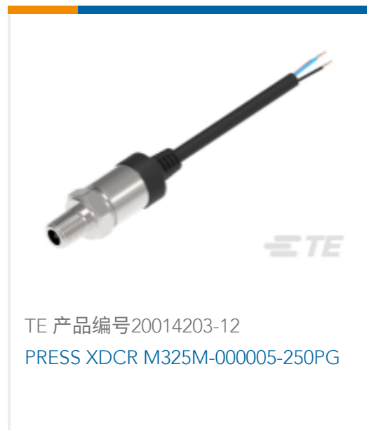
TE 产品编号 20014203-12 PRESS XDCR M325M-000005-250PG