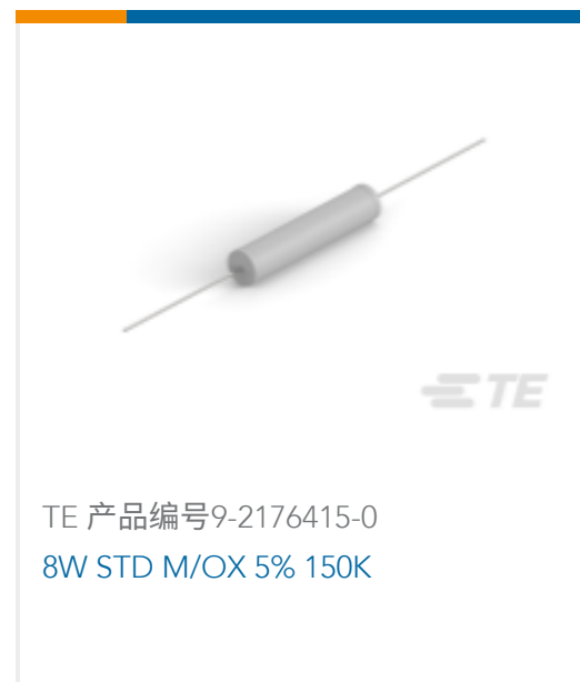
TE 产品编号 9-2176415-0 8W STD M/OX 5% 150K