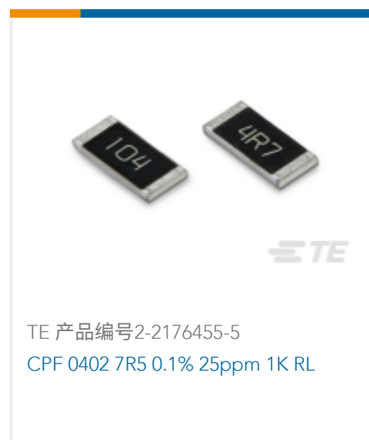
TE 产品编号 2-2176455-5 CPF 0402 7R5 0.1% 25ppm 1K RL