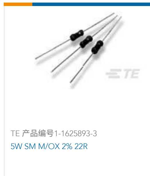
TE 产品编号 1-1625893-3 5W SM M/OX 2% 22R