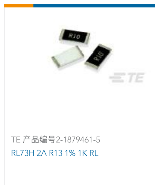
TE 产品编号 2-1879461-5 RL73H 2A R13 1% 1K RL