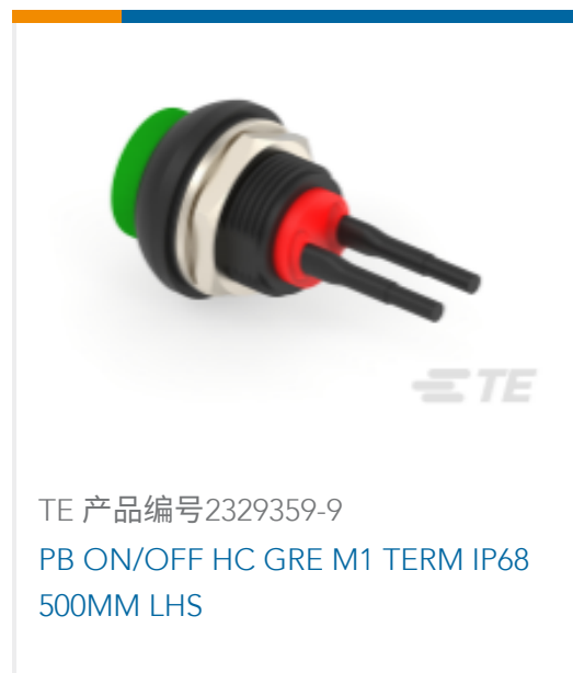
TE 产品编号 2329359-9 PB ON/OFF HC GRE M1 TERM IP68 500MM LHS