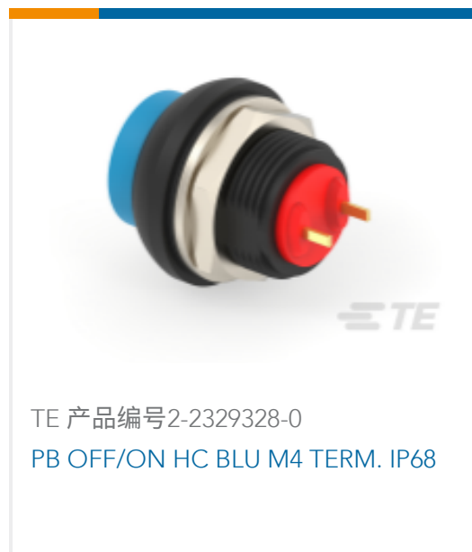
TE 产品编号 2-2329328-0 PB OFF/ON HC BLU M4 TERM. IP68