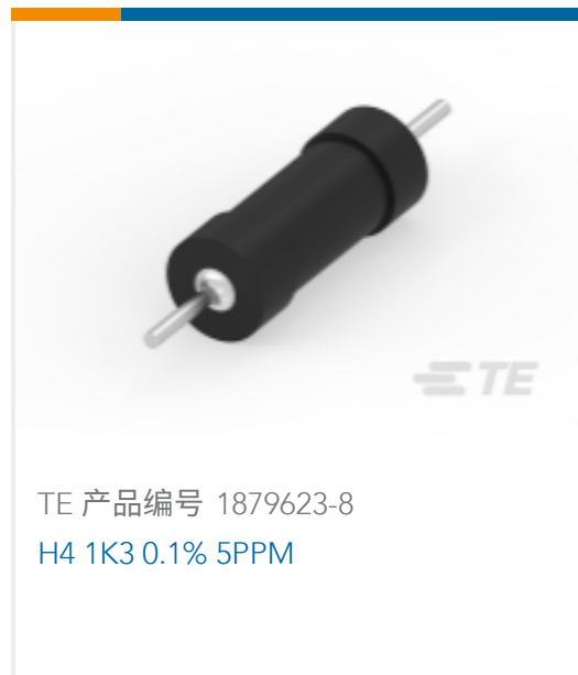
TE 产品编号 1879623-8 H4 1K3 0.1% 5PPM