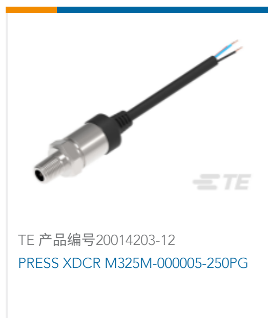
TE 产品编号 20014203-12 PRESS XDCR M325M-000005-250PG