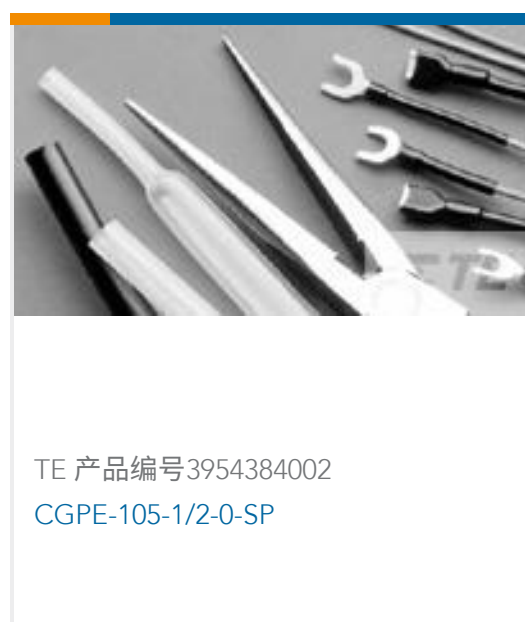
TE 产品编号 3954384002 CGPE-105-1/2-0-SP