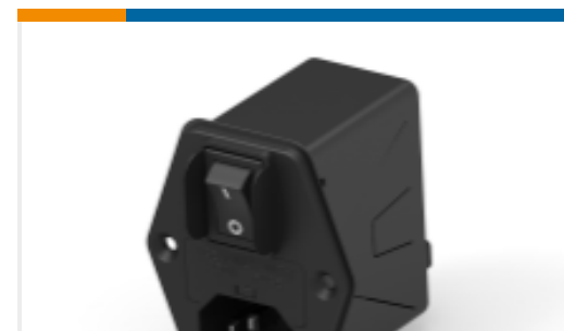
TE 产品编号8-1609158-8 10HPEGS1-HG=F8559