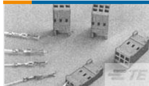
TE 产品编号182734-2 CONTACT REC HE14 COSI LOOSE P