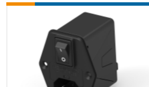
TE 产品编号7-1609158-3 12HPENS1-NG=F8539