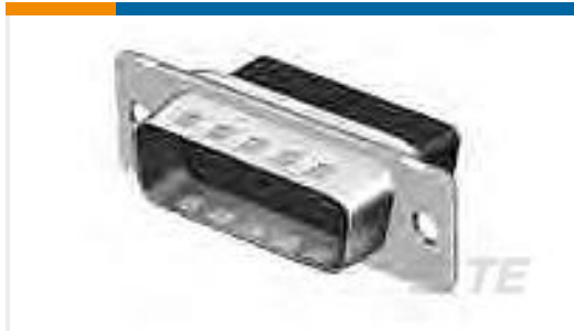
TE 产品编号205206-3 CRIMP SNAP PLUG ASSY,SIZE 2