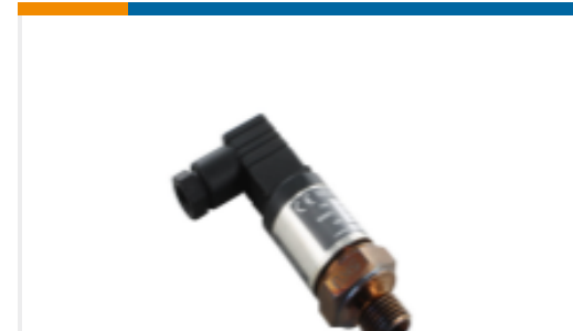
TE 产品编号20003318-00 紧凑型工业级压力传感器