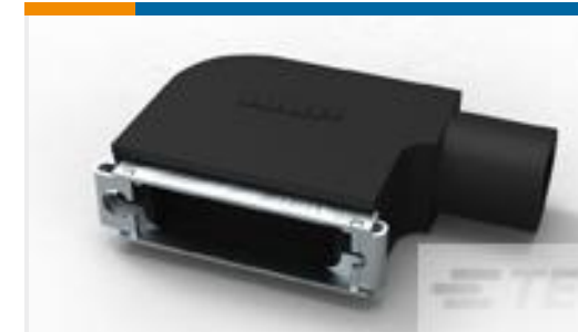
TE 产品编号5745652-2 DIECAST STRAIN RELIEF KIT,SZ 2