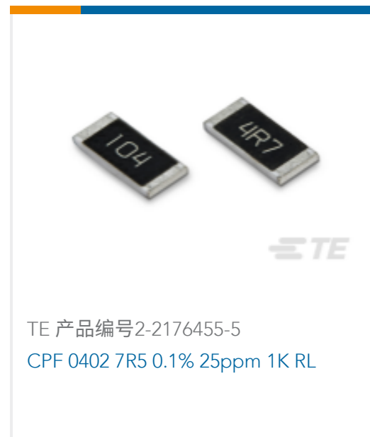
TE 产品编号2-2176455-5 CPF 0402 7R5 0.1% 25ppm 1K RL