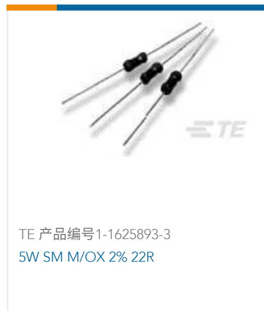
TE 产品编号1-1625893-3 5W SM M/OX 2% 22R