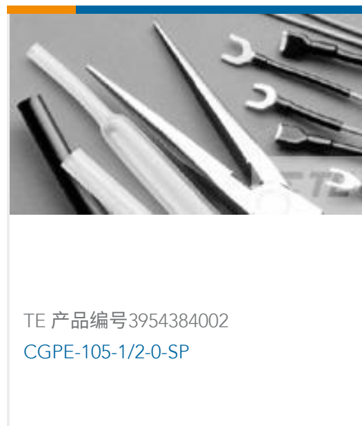
TE 产品编号3954384002 CGPE-105-1/2-0-SP