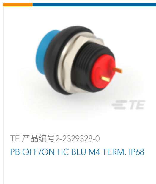
TE 产品编号2-2329328-0 PB OFF/ON HC BLU M4 TERM. IP68