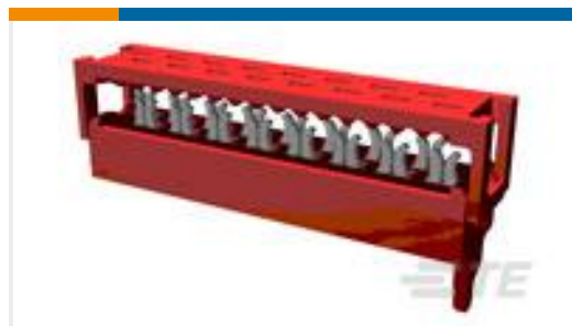
TE 产品编号215083-8 MICRO-MATCH MOW.08P