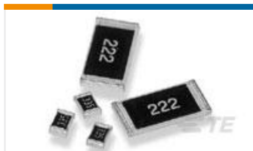
TE 产品编号2176186-1 CRGH1206 1% 120R 0.5W