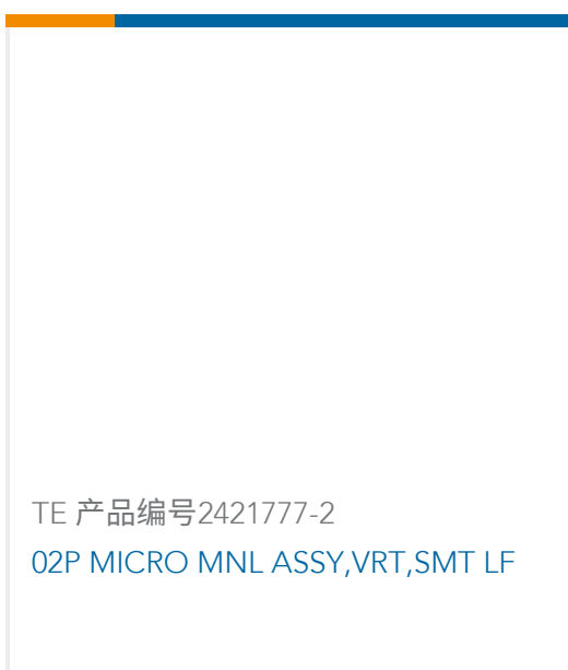
TE 产品编号2421777-2 02P MICRO MNL ASSY,VRT,SMT LF