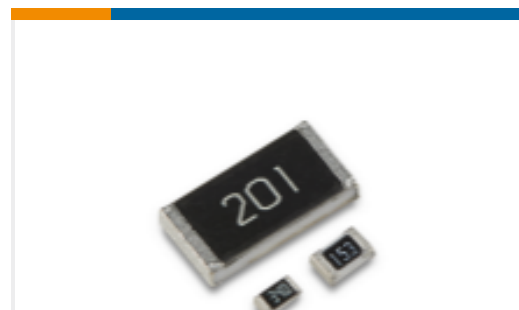
TE 产品编号2-2176326-6 CRGP 0603 1K2 1%