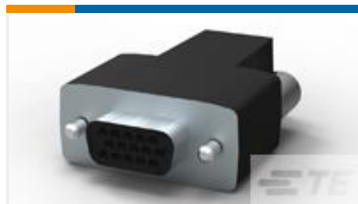
TE 产品编号1658688-1 KIT,HDP-22,ENCLSUR,RCPT,SIZE 1