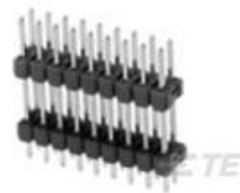
TE 产品编号5-146496-2 04 MODII HDR DRST UNSHRD STKG