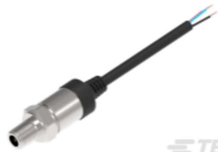
TE 产品编号20014203-12 PRESS XDCR M325M-000005-250PG