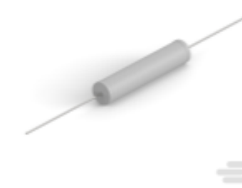
TE 产品编号9-2176415-1 8W STD M/OX 5% 160K