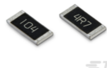
TE 产品编号2-2176455-5 CPF 0402 7R5 0.1% 25ppm 1K RL