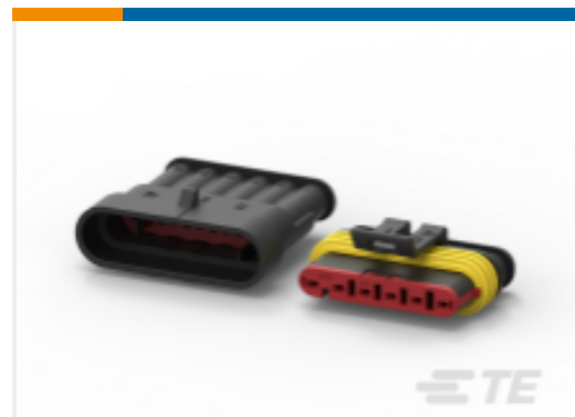
TE 产品编号282105-1 AMP SUPERSEAL 1.5MM, 连接器壳体