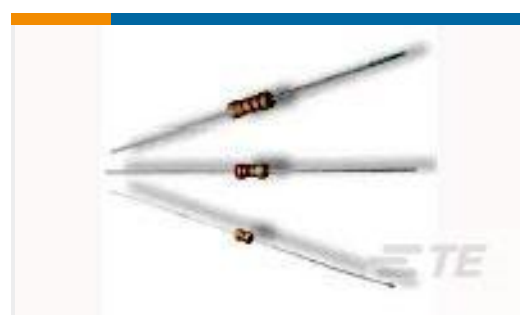
TE 产品编号3-1623932-6 CFR50 5% 1K0