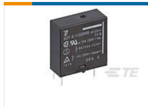
TE 产品编号8-1419125-0 SDT-S-105DMR,000