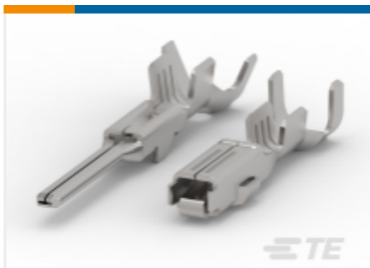
TE 产品编号183025-1 AMP SUPERSEAL 1.5MM, 母端和公端