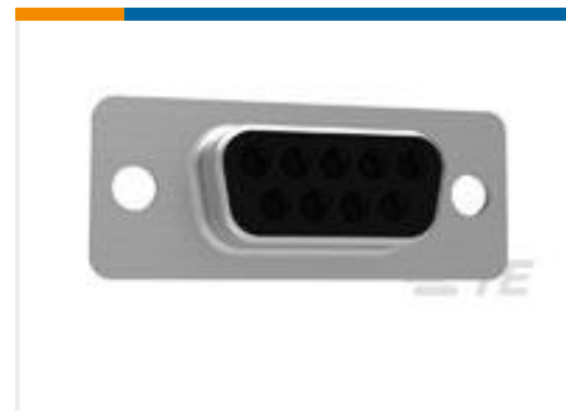
TE 产品编号5-747905-2 9 Rcpt Solder Cup, Gold Flash,