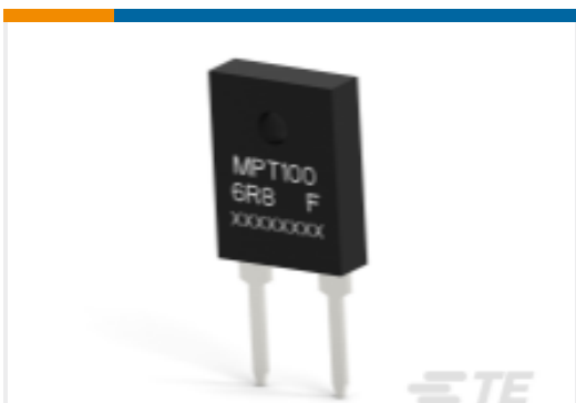
TE 产品编号3-2176429-0 MPT100 6K8 5%