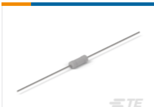
TE 产品编号8-1676123-1 1/2W SM M/OX 5% 1K8