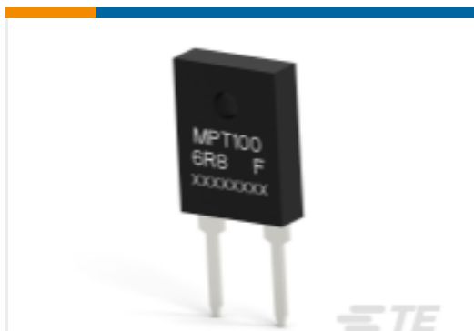
TE 产品编号2-2176429-7 MPT100 2K2 5%