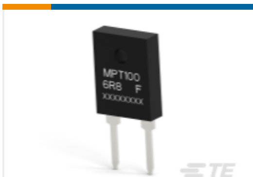
TE 产品编号2-2176429-5 MPT100 1K0 5%