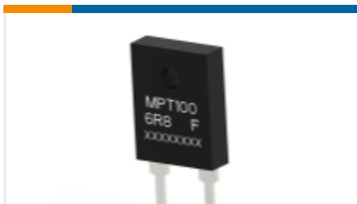
TE 产品编号3-2176429-1 MPT100 10K 5%