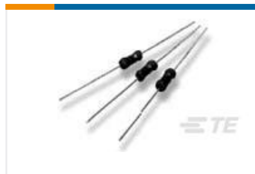
TE 产品编号1-1625893-3 5W SM M/OX 2% 22R