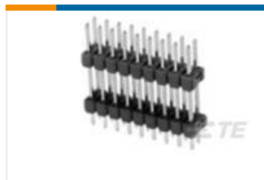
TE 产品编号5-146496-2 04 MODII HDR DRST UNSHRD STKG