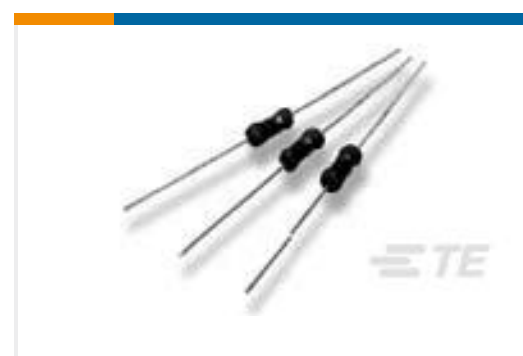
TE 产品编号1-1625893-3 5W SM M/OX 2% 22R