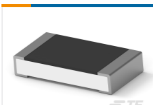
TE 产品编号1-2176391-0 RQ 1206 15K4 0.1% 10PPM 5K RL