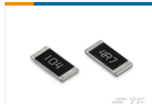
TE 产品编号2-2176455-5 CPF 0402 7R5 0.1% 25ppm 1K RL