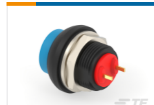
TE 产品编号2-2329328-0 PB OFF/ON HC BLU M4 TERM. IP68