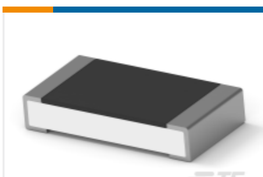
TE 产品编号1-2176391-0 RQ 1206 15K4 0.1% 10PPM 5K RL