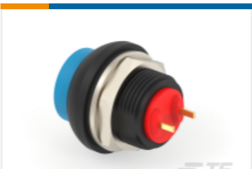
TE 产品编号2-2329328-0 PB OFF/ON HC BLU M4 TERM. IP68