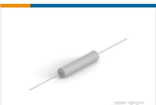
TE 产品编号9-2176415-1 8W STD M/OX 5% 160K