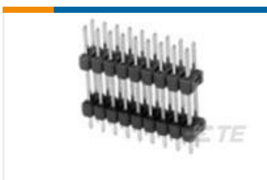
TE 产品编号5-146496-2 04 MODII HDR DRST UNSHRD STKG