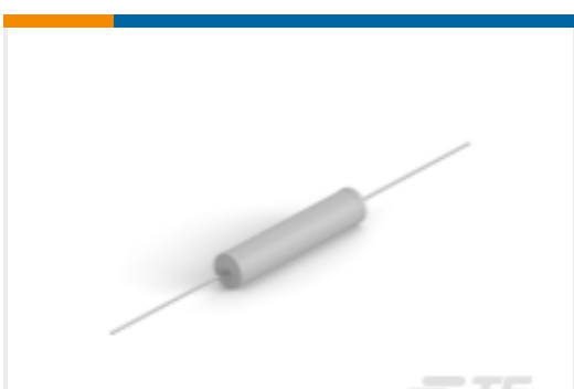
TE 产品编号9-2176415-0 8W STD M/OX 5% 150K