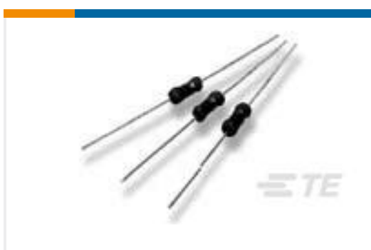
TE 产品编号1-1625893-3 5W SM M/OX 2% 22R