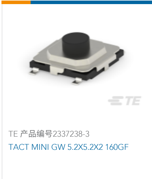
TE 产品编号2337238-3 TACT MINI GW 5.2X5.2X2 160GF