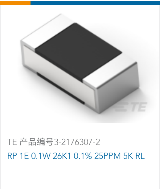
TE 产品编号3-2176307-2 RP 1E 0.1W 26K1 0.1% 25PPM 5K RL