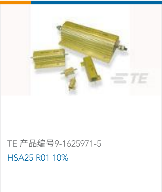
TE 产品编号9-1625971-5 HSA25 R01 10%