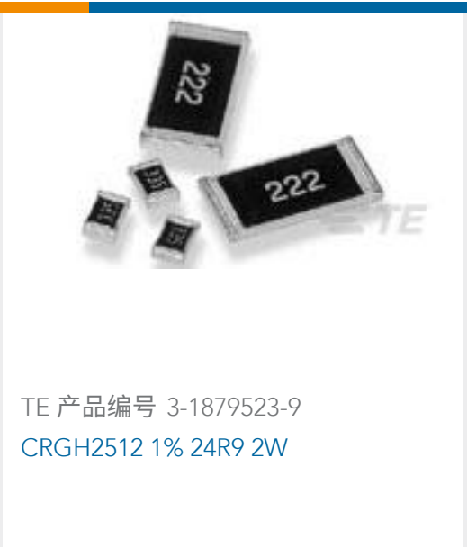
TE 产品编号 3-1879523-9 CRGH2512 1% 24R9 2W