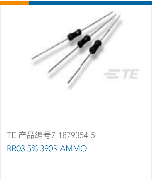
TE 产品编号7-1879354-5 RR03 5% 390R AMMO