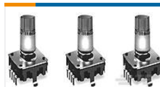
TE 产品编号 4-1879314-5 DPL12S 24P 24DET 25K RD/GRN