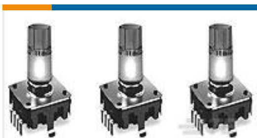
TE 产品编号 1-1879749-7 LED ENCODER 12MM HORIZ SW GR /RD