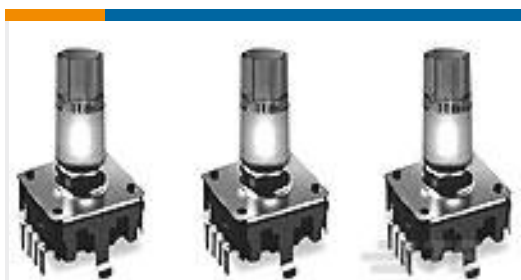
TE 产品编号 4-1879314-5 DPL12S 24P 24DET 25K RD/GRN