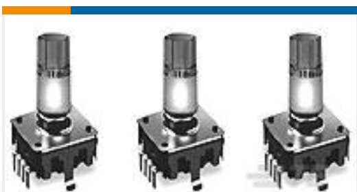
TE 产品编号 4-1879314-7 DPL12S 24P 24DET 21F RD/GRN