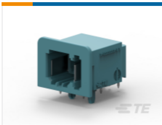
TE 产品编号9-2304372-9 1-PORT MATENET HDR ASSY 90DEG, COD Z