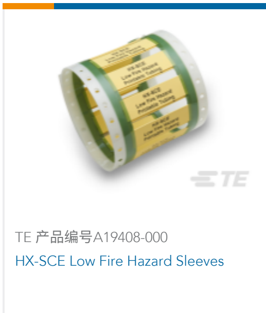
TE 产品编号A19408-000 HX-SCE Low Fire Hazard Sleeves