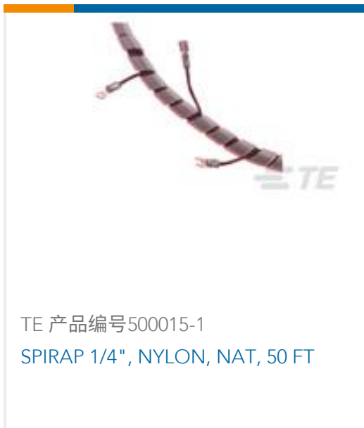
TE 产品编号500015-1 SPIRAP 1/4", NYLON, NAT, 50 FT