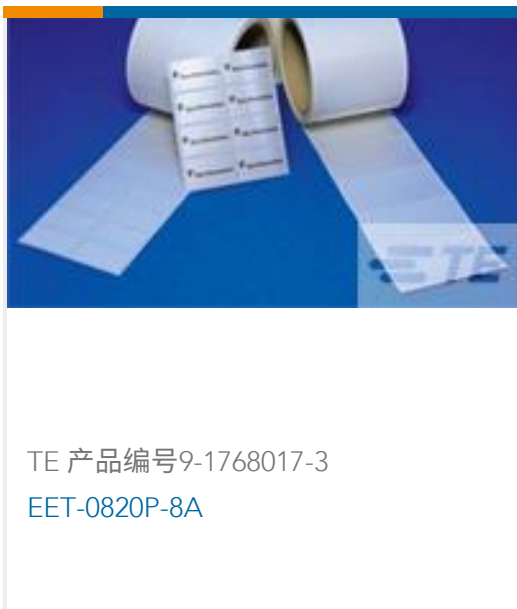
TE 产品编号9-1768017-3 EET-0820P-8A