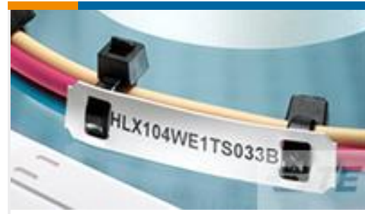
TE 产品编号CC0110-000 HLX125YW2NEL60S