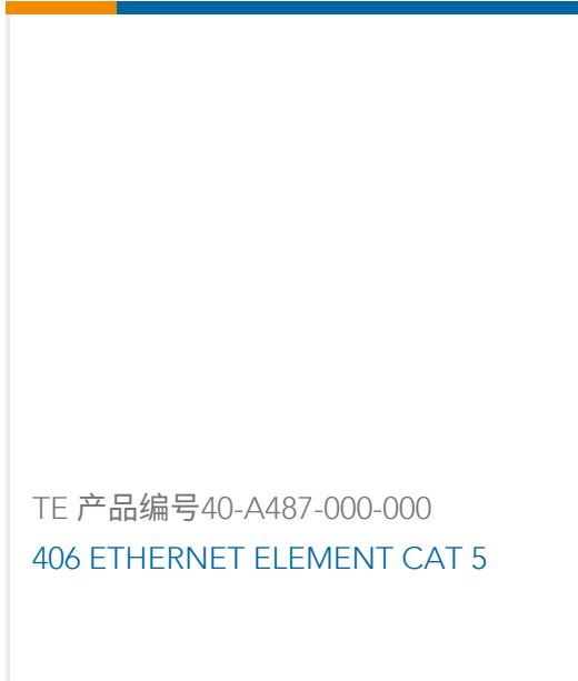
TE 产品编号40-A487-000-000 406 ETHERNET ELEMENT CAT 5