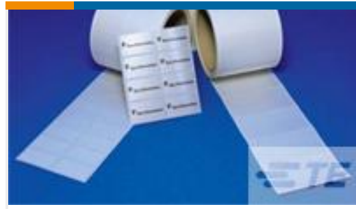
TE 产品编号2-1768019-4 EET-52105P-8A