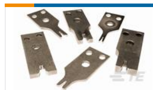
TE 产品编号1-1633730-2 CRIMPER, WIRE F .055 F