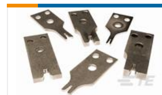
TE 产品编号1-679440-3 CRIMPER, INS. .063