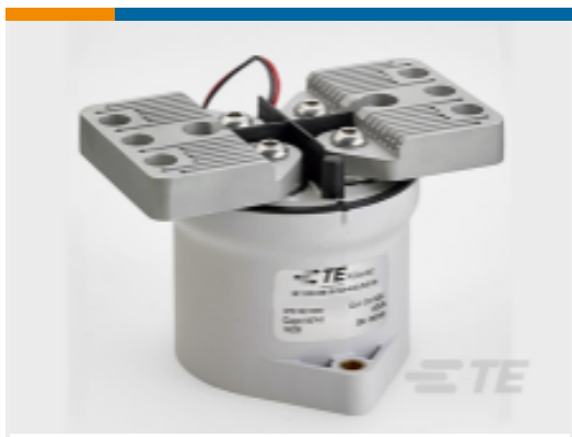
TE 产品编号 CAT-DC-K1K-CONT SPST: Kilovac K1K DC Contactors; Bi-directional Switching