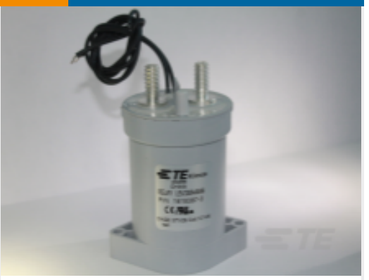
TE 产品编号 4-1618388-6 LEV200A5NAA=RELAY, SPST-NO