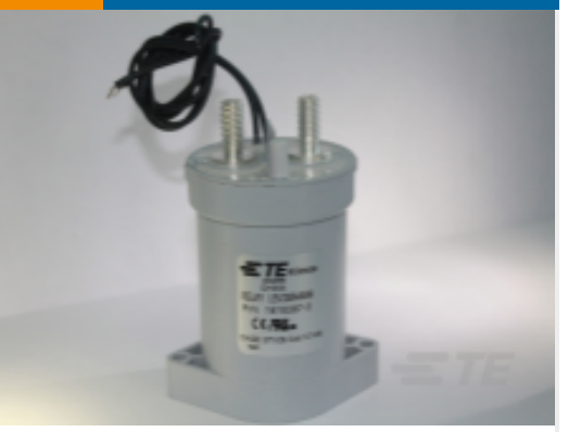
TE 产品编号 5-1618387-7 LEV200A5NAF=RELAY, 24Vdc SPST NO