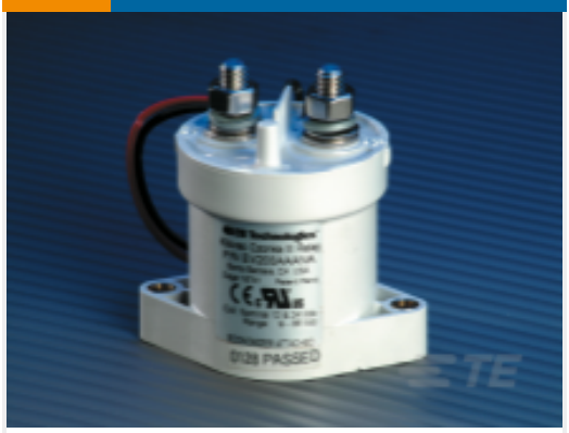
TE 产品编号 4-1618387-1 EV200HRANA=RELAY, SPST-NO