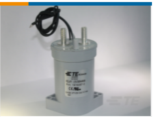
TE 产品编号 7-1618387-1 LEV200A5ANA=RELAY, SPST-NO