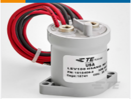
TE 产品编号 9-1618407-9 LEV100H5CNH=CONTACTOR WITH AUX, SPST