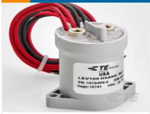
TE 产品编号 1618408-2 LEV100H5CNG = CONTACTOR WITH AUX SPST