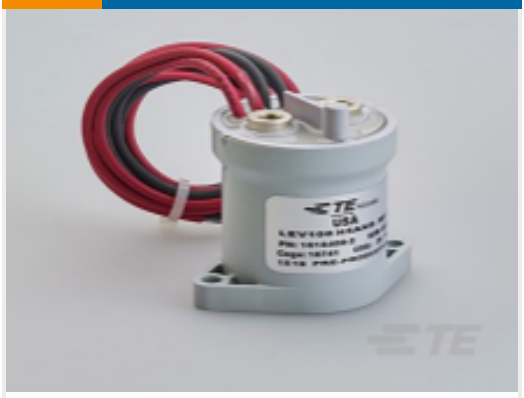
TE 产品编号 1618412-8 LEV100H5ANG=CONTACTOR WITH AUX SPST,15"