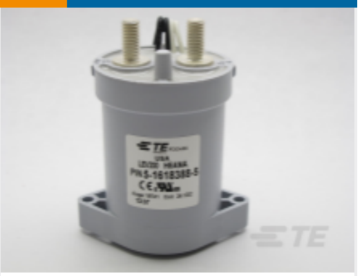
TE 产品编号 6-1618388-7 LEV200H5ANF=RELAY, SPST-NO