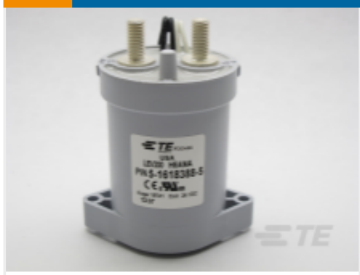
TE 产品编号 5-1618388-5 LEV200H5ANA=RELAY, SPST-NO