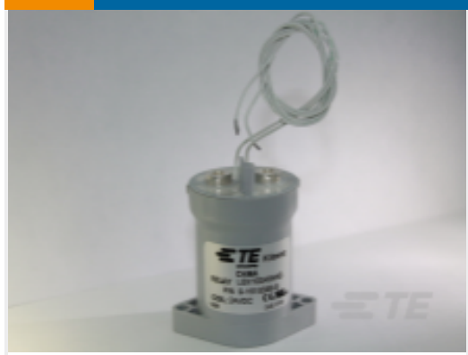
TE 产品编号 6-1618400-4 LEV100A7ANG=RELAY, 28Vdc SPST-NO