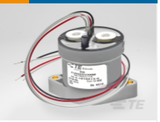
TE 产品编号 4-1618413-9 EV600HSANM = CONTACTOR, SPST-NO 24V COIL