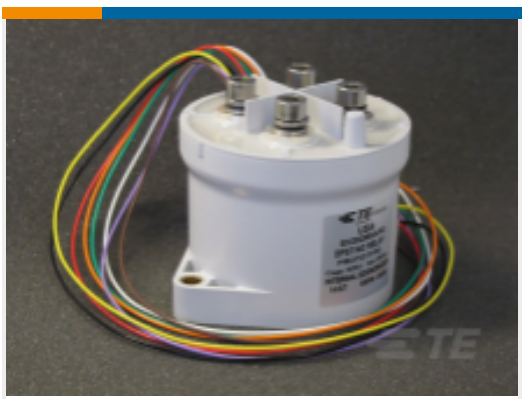
TE 产品编号 8-1618406-3 EV202ASAND=Relay, DPST-NO 28V