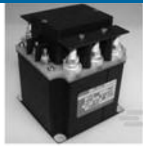
TE 产品编号1616021-6 SA136A=CONTACTOR 3PST N.O. 75