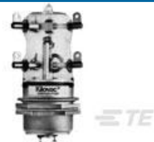
TE 产品编号1-1618273-5 H-16C=RELAY, VACUUM, DPDT