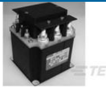
TE 产品编号1616021-6 SA136A=CONTACTOR 3PST N.O. 75