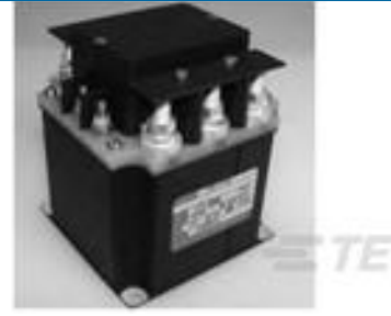
TE 产品编号1616021-6 SA136A=CONTACTOR 3PST N.O. 75