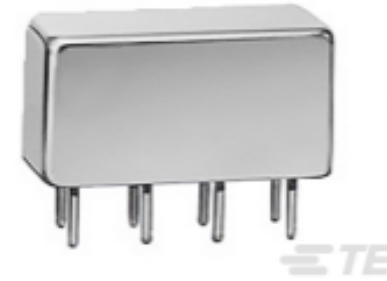
TE 产品编号3-1617536-2 HFW1230F01P=M39016/6-119P