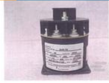
TE 产品编号1-1616037-6 DHR7B=CONTACTOR - 3PDT