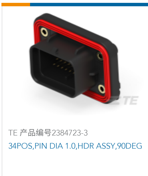
TE 产品编号2384723-3 34POS,PIN DIA 1.0,HDR ASSY,90DEG