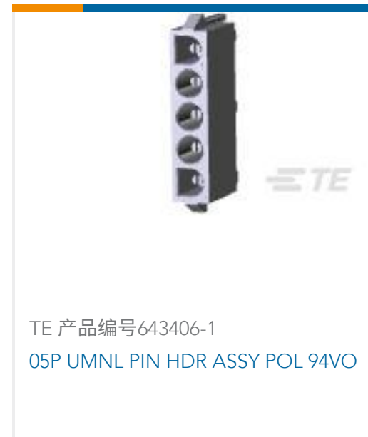
TE 产品编号643406-1 05P UMNL PIN HDR ASSY POL 94VO