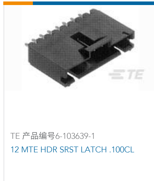
TE 产品编号6-103639-1 12 MTE HDR SRST LATCH .100CL