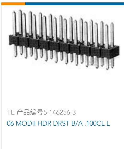
TE 产品编号5-146256-3 06 MODII HDR DRST B/A .100CL L