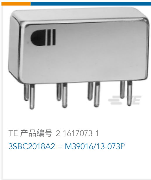
TE 产品编号 2-1617073-1 3SBC2018A2 = M39016/13-073P