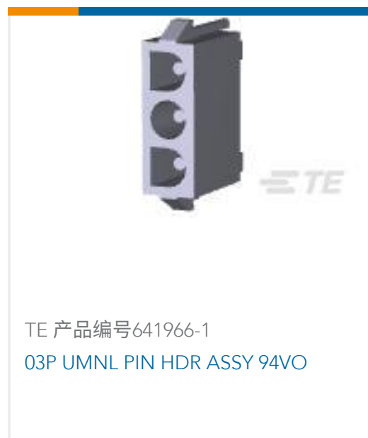
TE 产品编号641966-1 03P UMNL PIN HDR ASSY 94VO