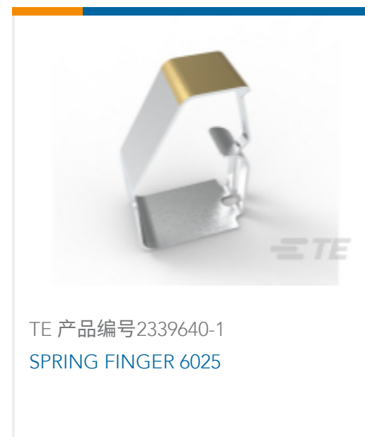
TE 产品编号2339640-1 SPRING FINGER 6025