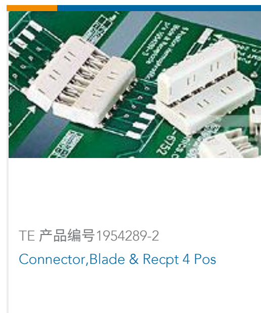
TE 产品编号1954289-2 Connector,Blade & Recpt 4 Pos