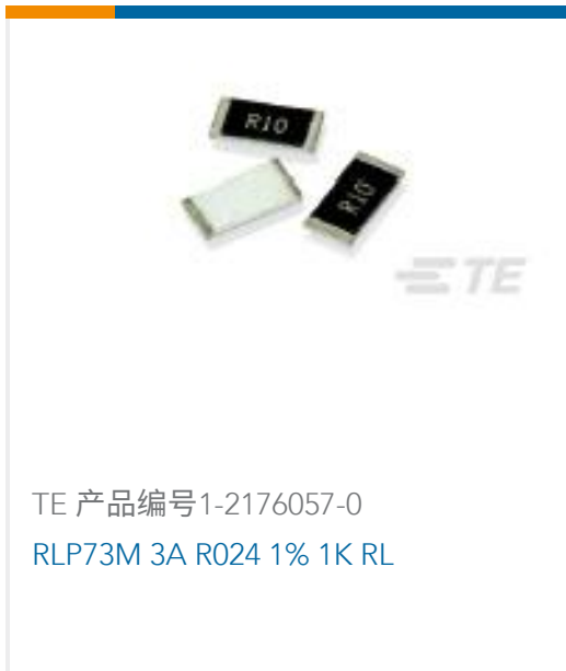
TE 产品编号1-2176057-0 RLP73M 3A R024 1% 1K RL