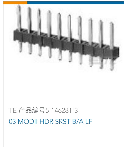
TE 产品编号5-146281-3 03 MODII HDR SRST B/A LF