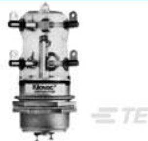
TE 产品编号1-1618273-5 H-16C=RELAY, VACUUM, DPDT