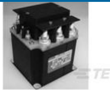
TE 产品编号1616021-6 SA136A=CONTACTOR 3PST N.O. 75