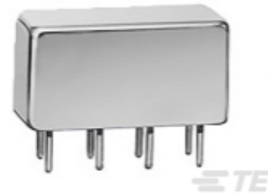
TE 产品编号3-1617536-2 HFW1230F01P=M39016/6-119P