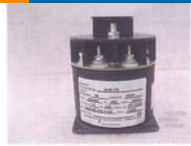
TE 产品编号1-1616037-6 DHR7B=CONTACTOR - 3PDT