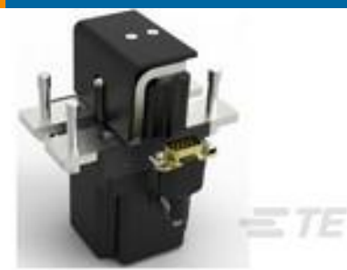
TE 产品编号1-1616989-7 KD400B2C2=CONTACTOR 1 NO 1 NC 400 AMP