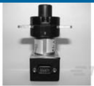
TE 产品编号5-1616986-9 K4001B8C3=CONTACTOR SPST NO DB 400 AMP