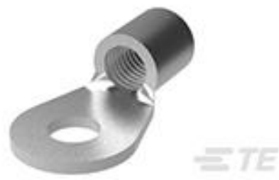
TE 产品编号36922-1 TERM,SOLIS R 2/0 5/16 90DEG