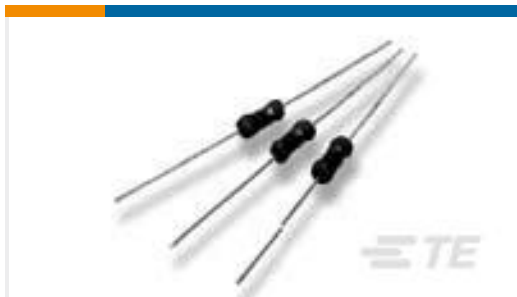
TE 产品编号7-1625890-0 2W SM M/OX 5% 82K