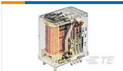
TE 产品编号1-1393767-5 R10-E2X2-V700=R10