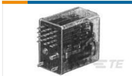
TE 产品编号1-1393766-9 R10-E1X4-24V=R10