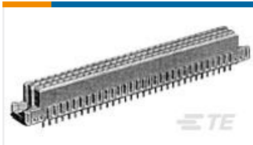
TE 产品编号535090-4 096 EURO TYPE C RECEPT ST ASSY