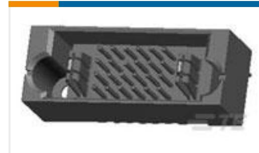
TE 产品编号6450820-2 MBXLE VERT HDR 1P+24S+1P