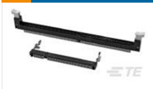
TE 产品编号1658912-5 ASSY, 0.00038MIN AU 3.18 TAIL