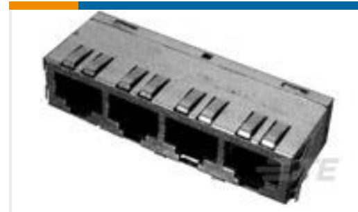
TE 产品编号5406281-3 MJ ASSY,4P,8POS,SH,RVPGT,CAT5