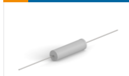
TE 产品编号7-2176414-5 7W STD M/OX 5% 24K