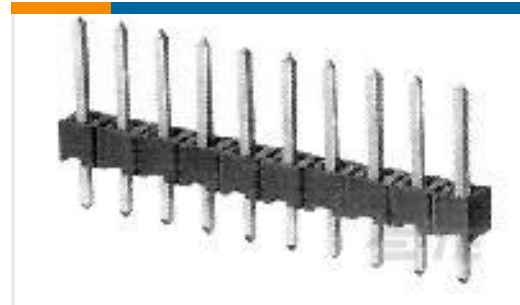
TE 产品编号3-825433-2 MOD 2 PINHDR 1X32P