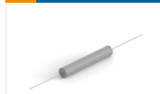
TE 产品编号4-2176416-1 9W STD M/OX 5% 2K4