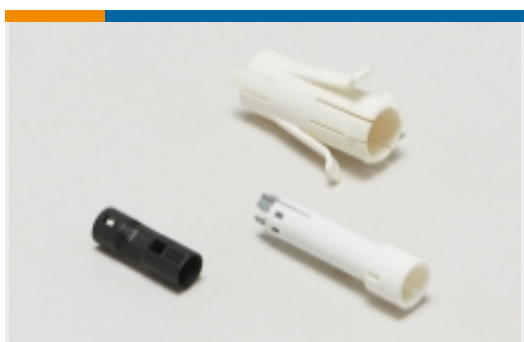
插头和插座照明连接器附件(1)