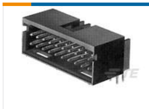
TE 产品编号5-103166-2 08 MODII HDR DRRR SHRD LF