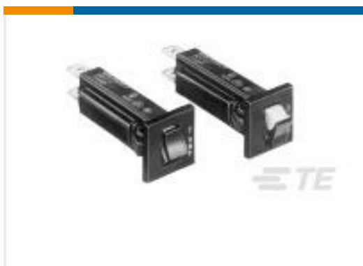
TE 产品编号3-1393250-8 W28-XQ1A-5=W28-