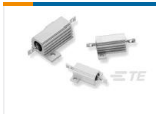
TE 产品编号6-1879071-5 THS50 2K7 5%