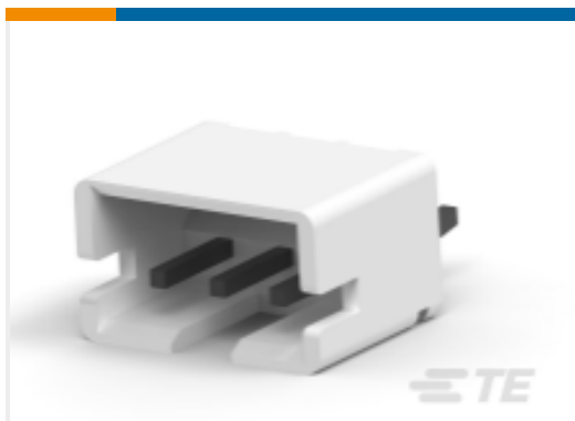
TE 产品编号440055-4 AMP HPI 2.0 mm Headers