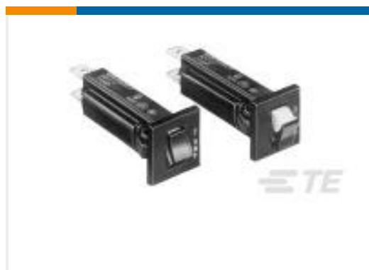
TE 产品编号2-1393250-5 W28-XQ1A-10=W28-