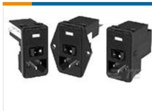
TE 产品编号6609102-1 PE0S0SBX0=C1164