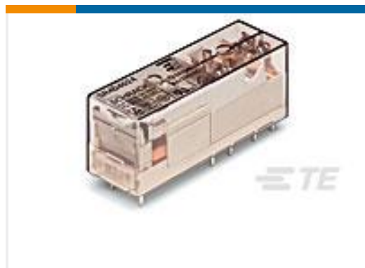
TE 产品编号4-1415053-1 SR4M4024