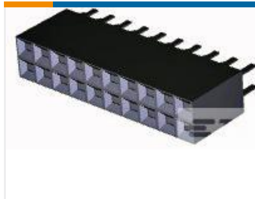
TE 产品编号6-534206-0 20 MODII VRT DR CE 100/115