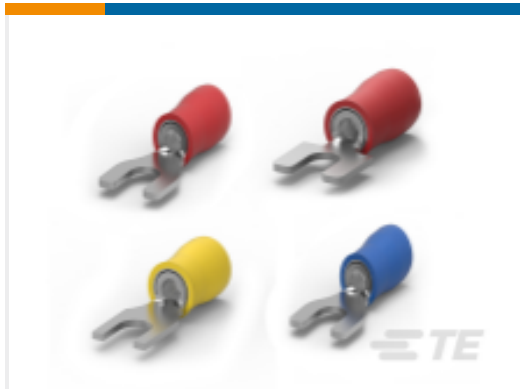
TE 产品编号328281 PIDG Spade Tongue Terminals