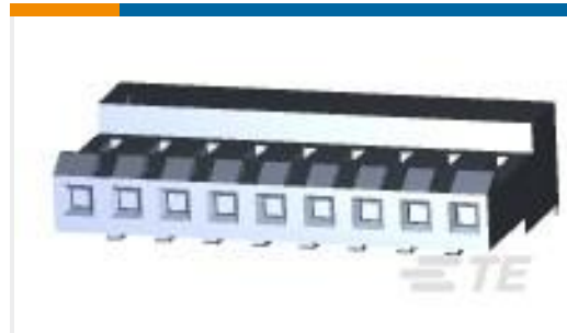
TE 产品编号3-640426-9 09P MTA156 CONN ASSY 18AWG ORA