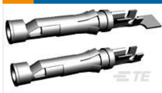
TE 产品编号1-66360-2 III+ SKT, 18-14, TIN, LP