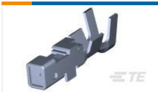
TE 产品编号1827570-2 DYNAMIC D1000 REC CONT M AU 0.38um FORM