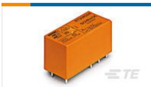
TE 产品编号6-1393238-8 RTD14024