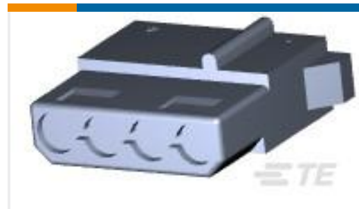
TE 产品编号1-480424-0 04P CMNL PLUG HSG F/H NATL