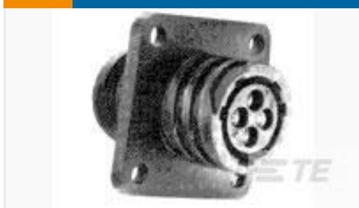
TE 产品编号211102-1 CPC RECEPT ASSEMBLY SIZE 11-4