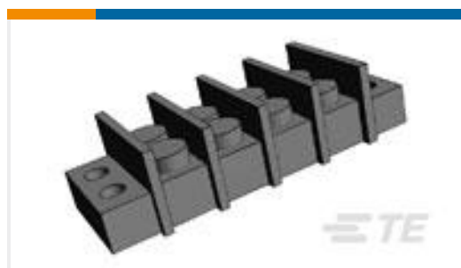
TE 产品编号1546306-4 4P .374" DR BARRIER STRIP