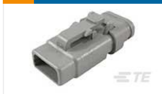
TE 产品编号DTM06-3S-E007 PLG, 3P, GRY, N, XCAP