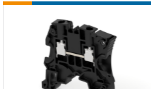
TE 产品编号1SNK506066R0000 ZS6-BK