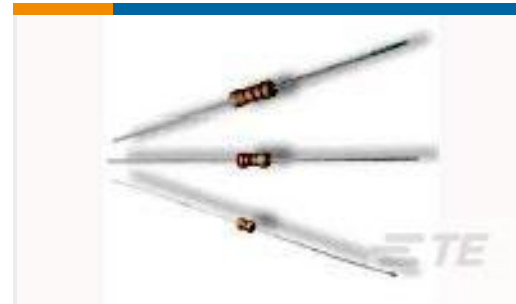
TE 产品编号1-1623925-5 CFR100 5% 1K0