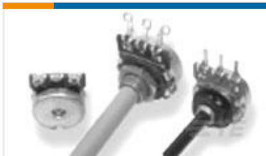
TE 产品编号1624209-2 23SE 4K7A 6.35X50FL B7 CAT