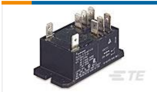
TE 产品编号9-1393211-1 T92S11D12-48