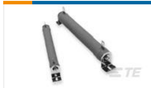
TE 产品编号1879452-1 TE 750W 1R0 5% Bracket