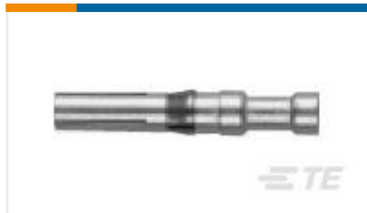
TE 产品编号1-1105301-1 HVT-C-Bu.Ag,0,5 qmm