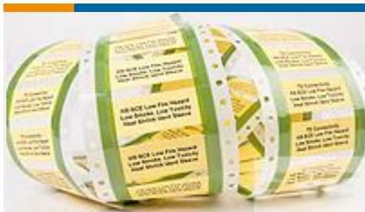
TE 产品编号A55157-000 HX-SCE-38.1-50-S1-4