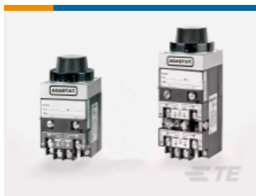
TE 产品编号7-1472995-5 7012WBLV=RLY,STD,ON,2P,96V,5S,L,V