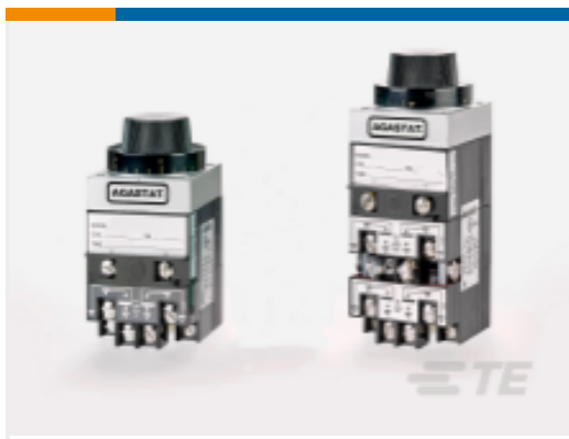
TE 产品编号 1423174-1 E7024AB004=RLY,NUC,OFF,4P,120