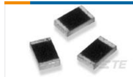
TE 产品编号1-1879274-9 RP 2A 1K33 0.1% 15PPM CUT LENGTH