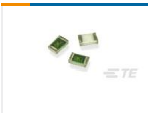
TE 产品编号1676187-1 RN 0805 143R 0.1% 10PPM CUT LENGTH