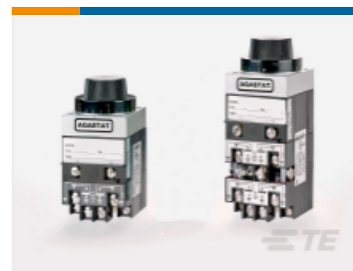
TE 产品编号8-1437487-2 7012OBLV=24V DC 0.5-5.0 SECS