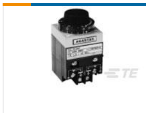
TE 产品编号1-1755142-3 7022WKTV=RLY,STD,OFF,2P,96V,300S, T,V