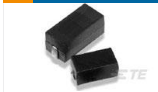
TE 产品编号6-1879011-5 SMF2 100K 5%