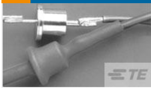
TE 产品编号5677934005 RNF-3000-9/3-X-SP