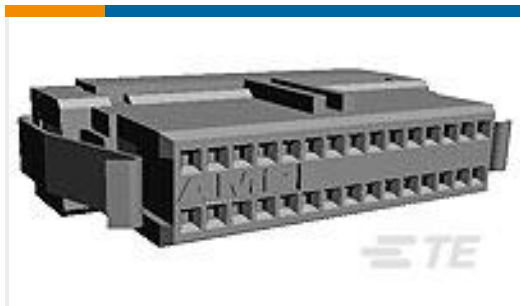
TE 产品编号1-111196-9 30 RCPT SYSTEM 50, LEAD FREE