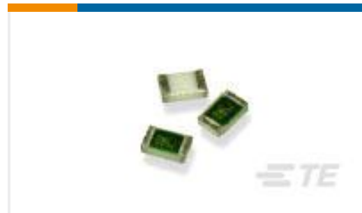
TE 产品编号5-1879208-9 CPF 0402 2K7 0.1% 25PPM 1K RL