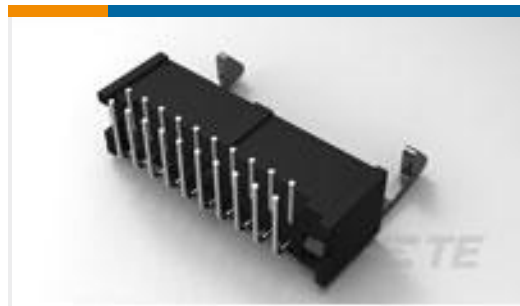
TE 产品编号2-1761607-7 IDC LOW PRO HDR 20P RA LG LAT