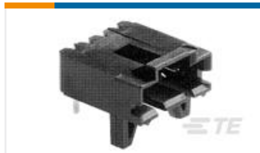
TE 产品编号5-103904-1 2 MTE HDR SRRA LATCH W/HLDWN