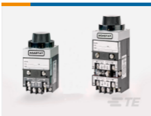
TE 产品编号 1-1423162-8 7022AK=RLY,STD,OFF,2P,120VAC,1