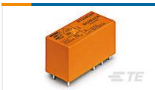
TE 产品编号5-1393239-4 RT214012