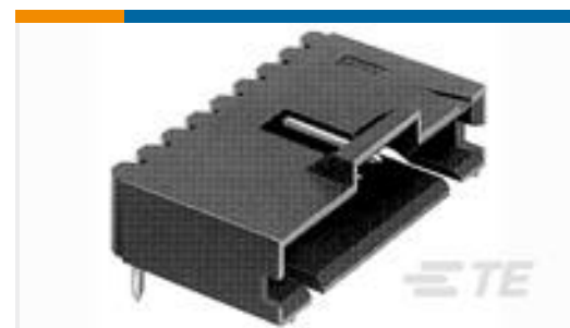
TE 产品编号5-103635-3 04 MTE HDR SRRA LTCH.100CL LF