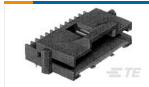
TE 产品编号5-104074-7 04 SYSTEM 50 HDR SRRA SHRD SN