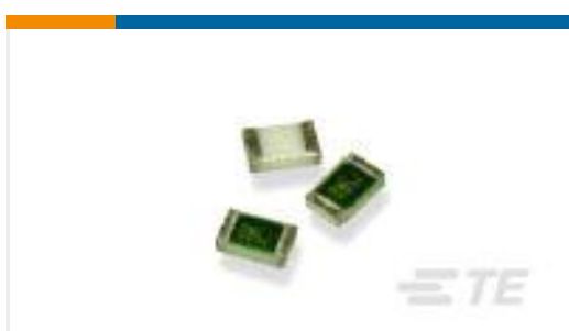
TE 产品编号6-1676481-8 CPF 0603 4K3 0.1% 25PPM 1K RL