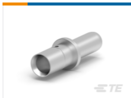
TE 产品编号SRK-PC-080-25-601 PIN, SOLID, SIZE M8, 25mm2, AG