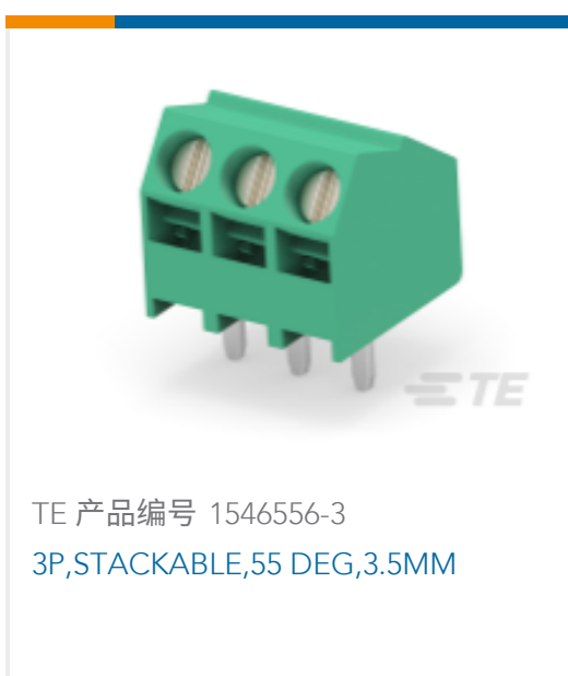
TE 产品编号 1546556-3 3P,STACKABLE,55 DEG,3.5MM